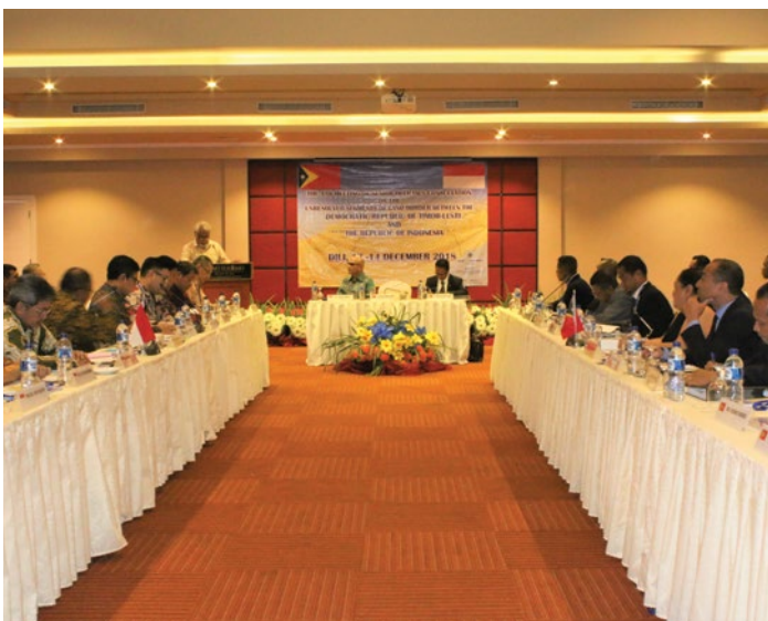
Konsultasaun Oficial Senior nian ba dahaat kona-ba Fronteiras Terrestres entre Timor-Leste no Indonézia, dezembru 2018

Konsultasaun Oficial Senior nian ba dahaat kona-ba fronteiras terrestres entre Timor-Leste ho Indonézia ne'e halao iha Díli iha 13-14 dezembru 2018. Reuniaun ne'e atinji progresu boot ida, hodi tau fundasaun ba akordu final ida kona-ba fronteiras terrestres entre nasaun rua ne'e. S.E. Xefe Negosiador Xanana Gusmão halo abertura ba delegasaun sira hodi ko'alia kona-ba segmentu rua iha fronteira ne'ebé seidak rezolve, mak Noel Besi/Citrana no Bidjael Sunan-Oben. Importante liu mak, nasaun rua ne'e konkorda ona atu halao vizita conjunta ba terrenu, no konkorda mos termu referensia ba áreas hirak ne'ebé sei ba halo vizita conjunta ne'e. Ida ne'e hakat importante tebes ida ne'ebé presiza hodi apoia desizaun hodi rezolve fronteiras final. Vizita conjunta ne'e sei halao iha semetre dahuluk 2019 nian.