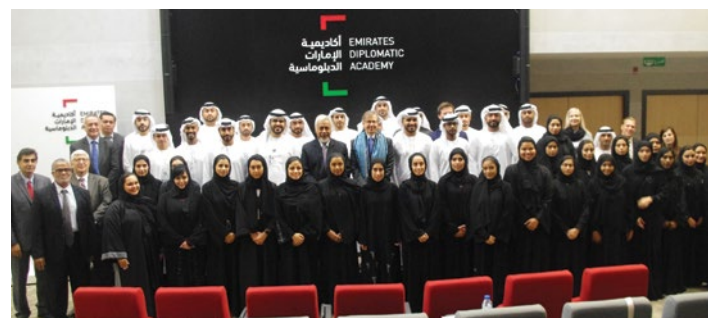
S.E. Xefe Negosiador Xanana Gusmão ho estudante sira Akademia Diplomata Emiradus iha Abu Dhabi, 13 janeiru 2019