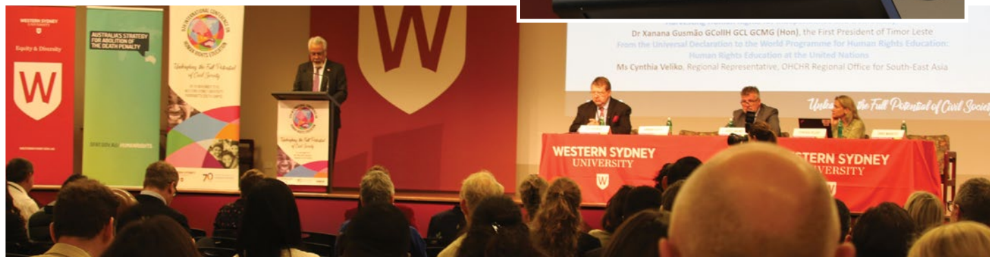
S.E. Xefe Negosiador Xanana Gusmão fó nia diskursu: “Halibur Direitus Umanus ba Independênsia no Demokrasia,” iha Universidade Western Sydney, 27 novembru 2018