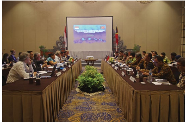
Reuniaun Esploratória Dahuluk ho Indonézia, iha Bali, 11 dezembru 2018