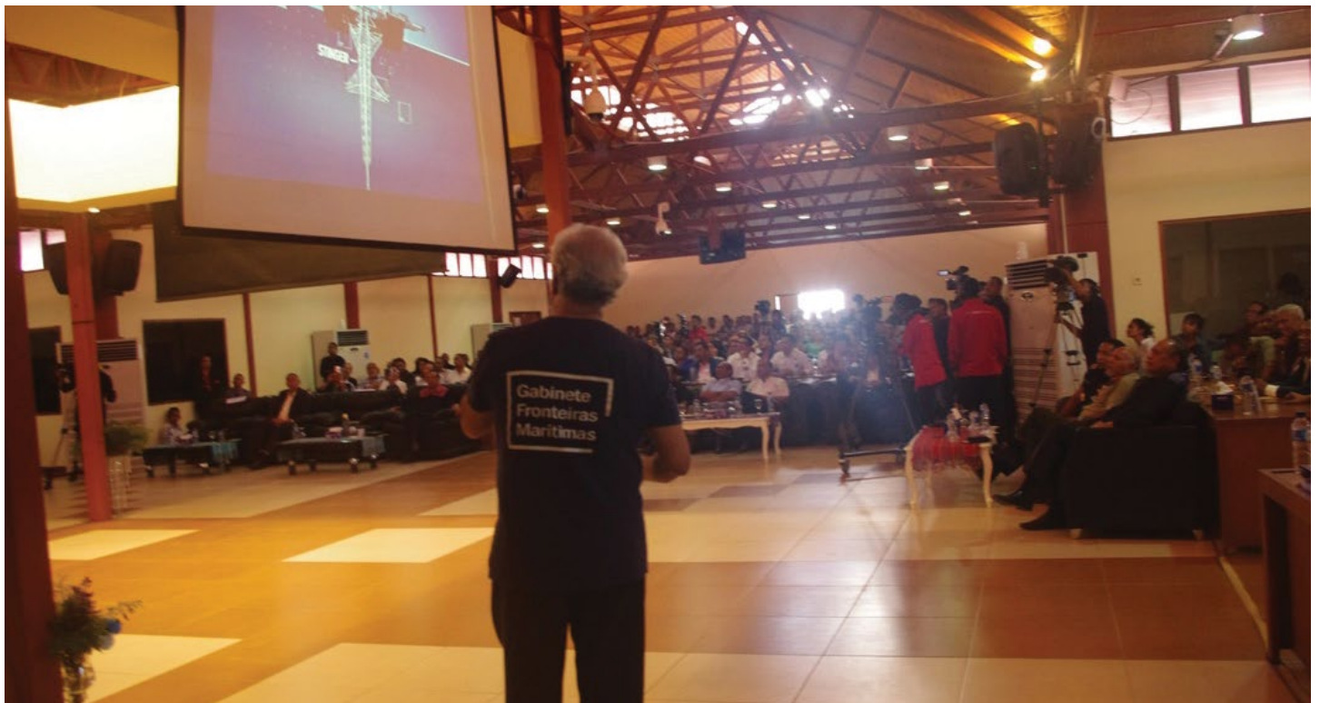
S.E. Xefe Negosiador Xanana Gusmão iha CCD durante Konferensia Nasional kona-ba Fronteiras Marítimas, Díli, 8 novembru 2018

Ema 1000 resin mak atende seminariu ne'e no fó sai transmisaun direta liuhusi GMNTV no TVTL. Iha nia diskursu ikus, Xefe Negosiador bolu ba setor idak-idak: agrikultura, defeza, negosius, veteranus, foinsa'e sira no setor privadu sira atu servisu makas hodi kontribui ba Timor-Leste nia dezvoltamentu.