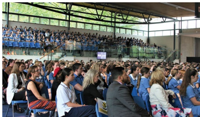
S.E. Xefe Negosiador Xanana Gusmão vizita estudante sira iha Monte Sant’ Angelo Mercy College, Sydney, 27 novembru 2018