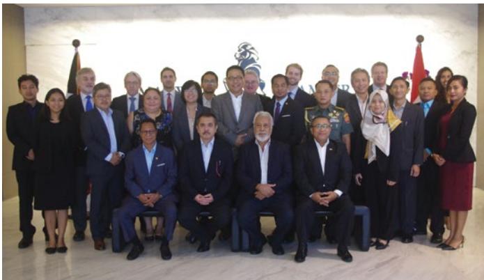
Reuniaun Esploratória Daruak ho Indonézia, iha Singapura, 27 febreiru 2019