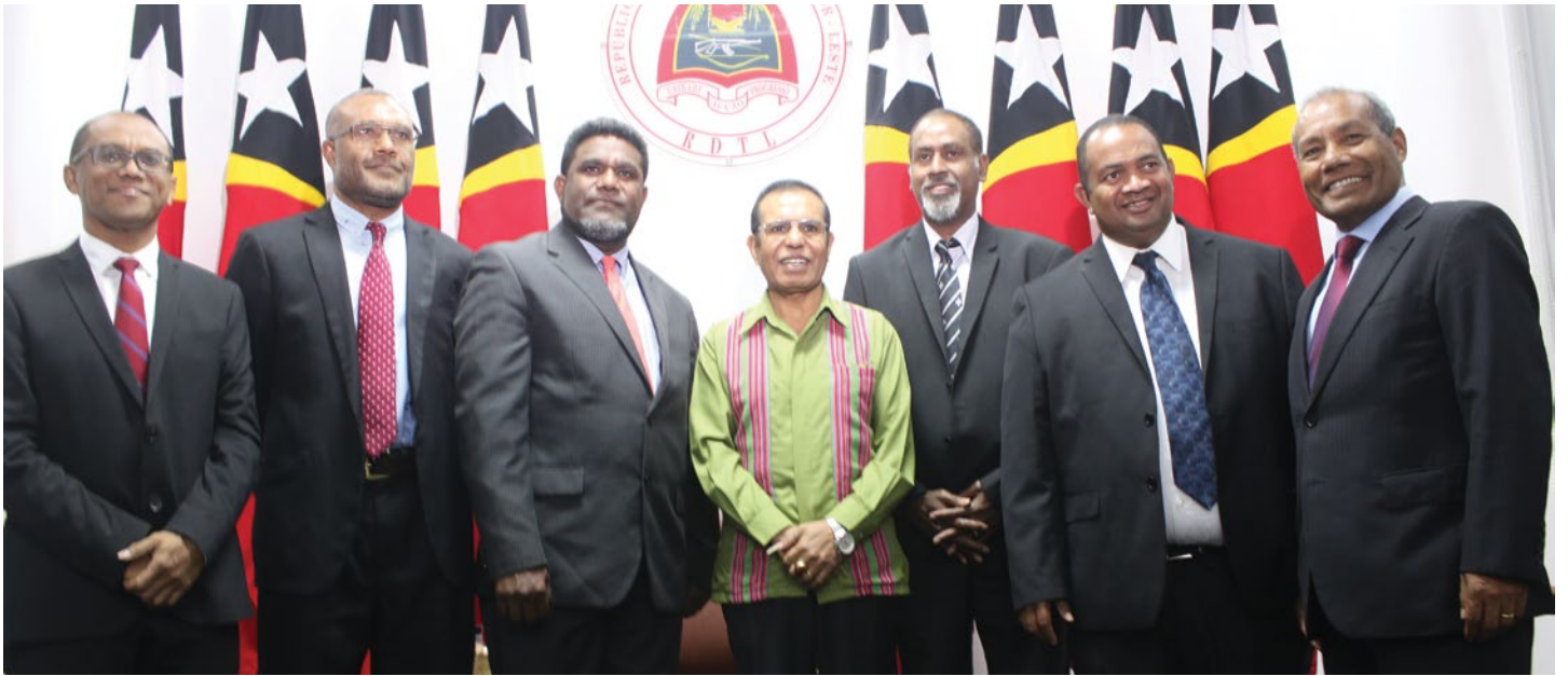
S.E. Primeiru Ministru Taur Matan Ruak ho delegasaun husi Vanuatu, Dili, 6 febreiru 2019