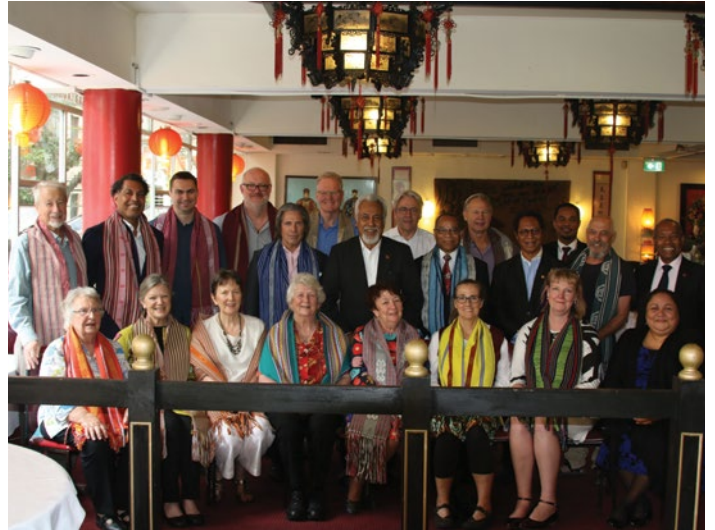
S.E. Xefe Negosiador Xanana Gusmão ho apoiante sira husi Austrália iha Sydney, 27 novembru 2018